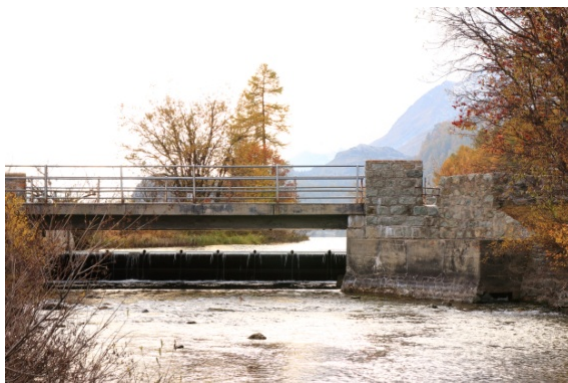
Wehr Sils Baselgia (Sils i. E.)